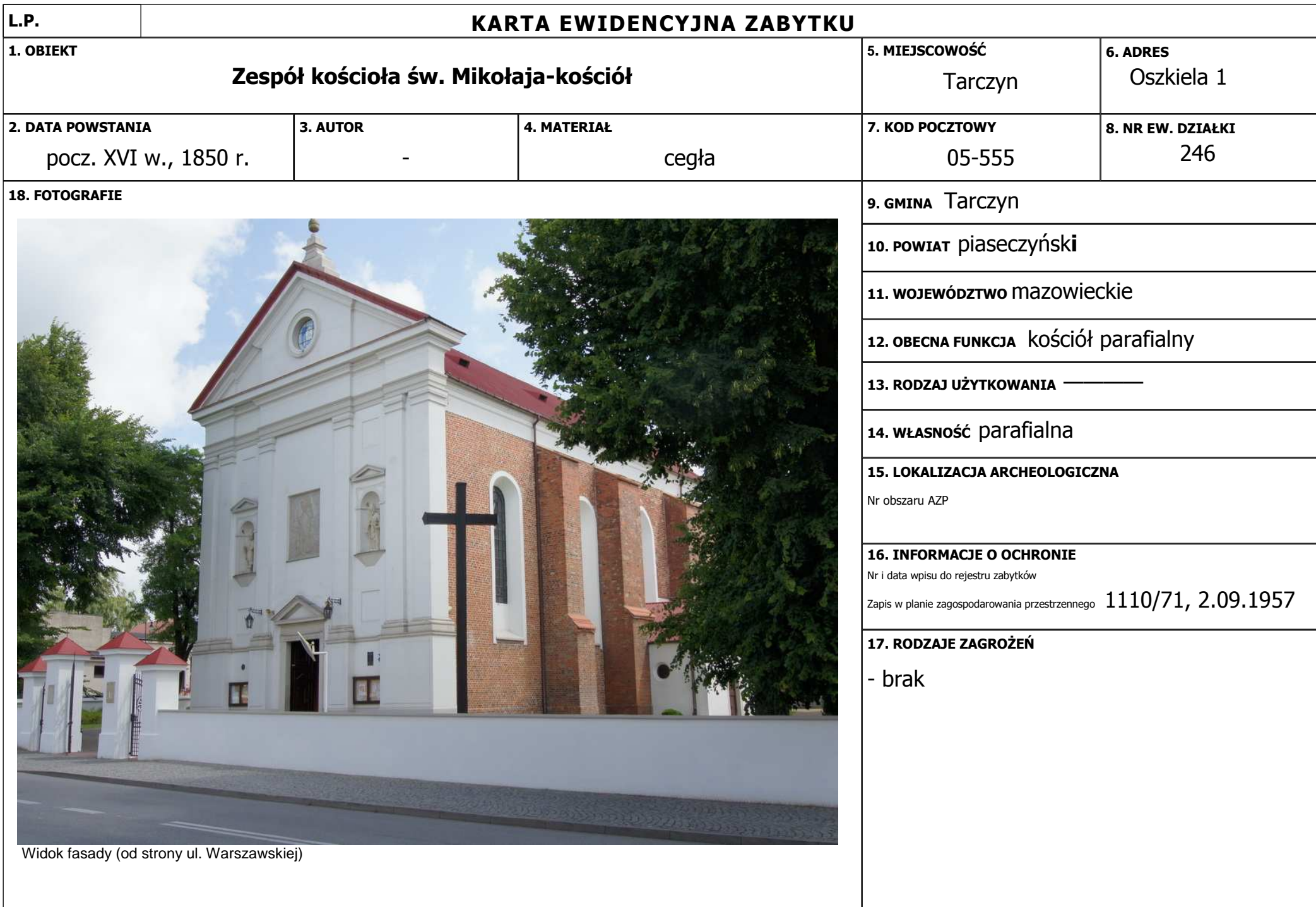
Widok fasady (od strony ul. Warszawskiej)