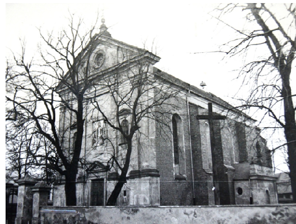
Zdjęcie archiwalne, WUOZ Radom