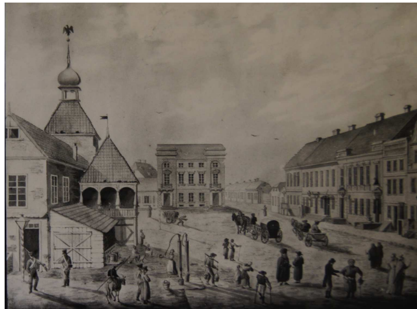
A. Karszowiecki, dawny Rynek w Płocku ze starym ratuszem, 1813 r.